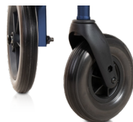
Ruedas delanteras de 5 cm de ancho